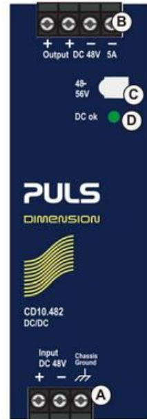
Fig. 10-1 Front side