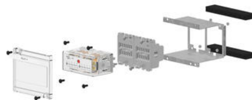
Bild 6 visar en spränkskiss på ingående komponenter.