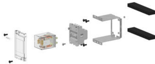
Bild 4 visar spränkskiss på ingående komponenter.