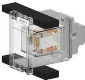
Bild 3 visar en storlek 2 enhet ihopsatt och monterad på rackets topp och botten skenor.