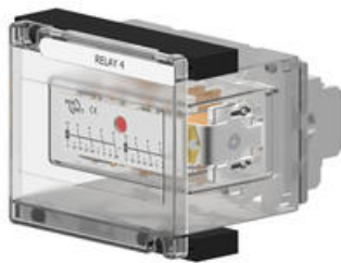
Bild 5 visar en storlek 4 enhet ihopsatt och monterad på rackets topp och botten skenor.