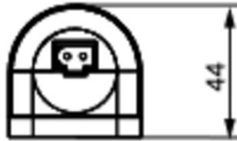
View of screw fixing