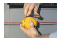
4. Justera systemet