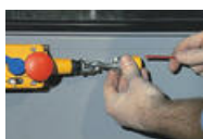
1. Trä på linlås ett