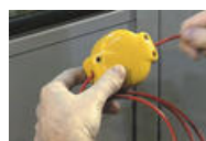
2. Trä på upphängningsögglor samt linspännare