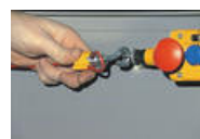
3. Trä på linlås två